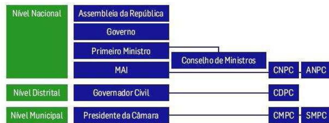
Esquema 2 – Estrutura da Protecção Civil

Assim a estrutura da Protecção Civil organiza-se ao nível Nacional, Regional e Municipal, como mostra o esquema que se segue.