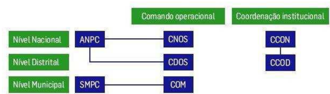
Esquema 4 - Estrutura das operações

De acordo com o exposto na Lei n.º 65/2007 de 12 de Novembro e no Decreto-Lei n.º 134/2006 de 25 de Julho, a estrutura das operações é a que seguidamente se expõe.